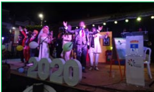
Chirigota "Cuando un amigo se va". Almodóvar