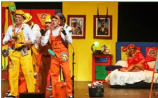
Chirigota Colona. "Los que salen del armario"