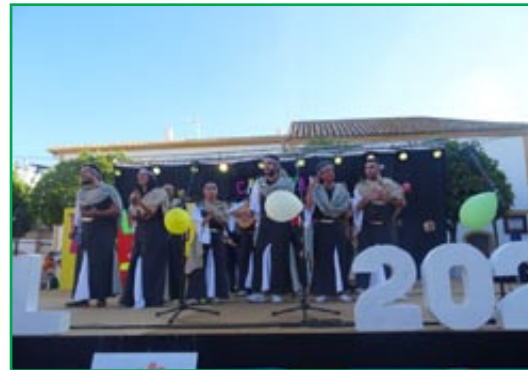
Comparsa. "Los Defensores", de Córdoba