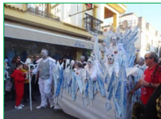
El Reino de Hielo. Ganadores del concurso de disfraces